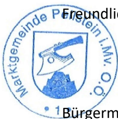
Bürgermeister Felix Grubich